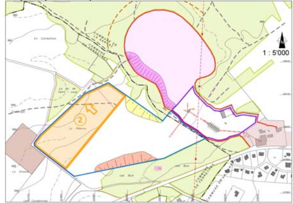
Etape 2 (18-30 ans)