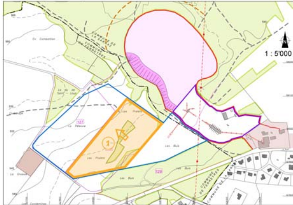
Etape 1 (6-18 ans)